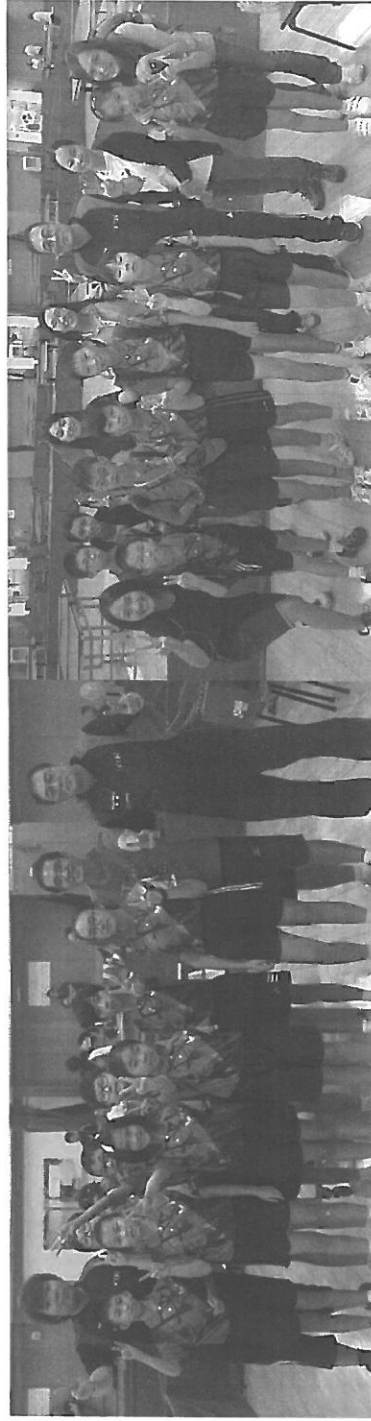
2015-16 年度北區學界比賽 (男子團體殿軍)

歷屆乒乓球隊均經過系統地訓練，並屢獲北區學界比賽乒乓球賽團體及個人獎項。我們盼望培訓新秀，提升學生對乒乓球的興趣及水平，並代表學校參與比賽。